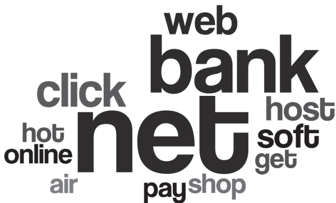
Рис. 1. Лексична хмара, що унаочнює лексеми, найчастотніше вживані при словотворі сайтонімів комерційної зони

Складені сайтоніми на позначення сайтів, які покликані інформувати користувача про найактуальніші події та надавати інформацію про навколишні установи, найчастіше містять наступні лексеми: