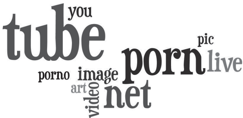
Рис. 3. Лексична хмара, що унаочнює лексеми, найчастотніше вживані при словотворі сайтонімів рекреаційної зони