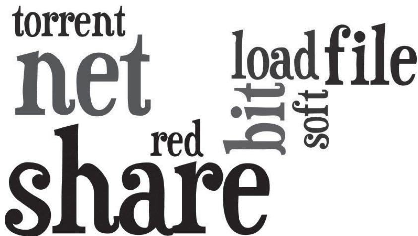
Рис. 6. Лексична хмара, що унаочнює лексеми, найчастотніше вживані при словотворі сайтонімів файлообмінної зони

Як свідчать результати наших розрахунків, компонентами сайтонімів на позначення сайтів, що дозволяють користувачам обмінюватись файлами між собою, найчастіше є слова, які вказують на функціонал сайту — share , load , torrent , file тощо. Також частотно уживаним є слово bit , яке метонімічно вказує на файли (файл складається з оди-