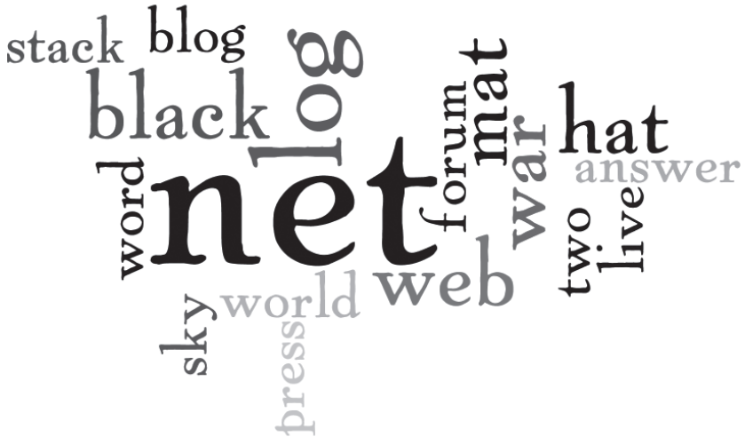
Рис. 4. Лексична хмара, що унаочнює лексеми, найчастотніше вживані при словотворі сайтонімів комунікативної зони

му спілкуванню — net та web . Частотними є лексеми на позначення функціоналу сайту — word , answer , forum тощо.