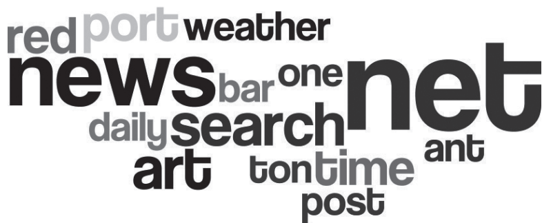
Рис. 2. Лексична хмара, що унаочнює лексеми, найчастотніше вживані при словотворі сайтонімів інформаційної зони

Згідно з результатами наших розрахунків, домінантні позиції серед лексем, що утворюють складені сайтоніми інформаційної функціональної зони, займають слова на позначення типу інформації, що можна знайти на сайті — news , weather , search тощо. Також є частотни-